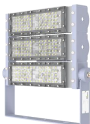
FLEDRR25 150W – 180W