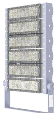
FLEDRR25 300 - 360W