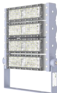
FLEDRR25 200W – 240W